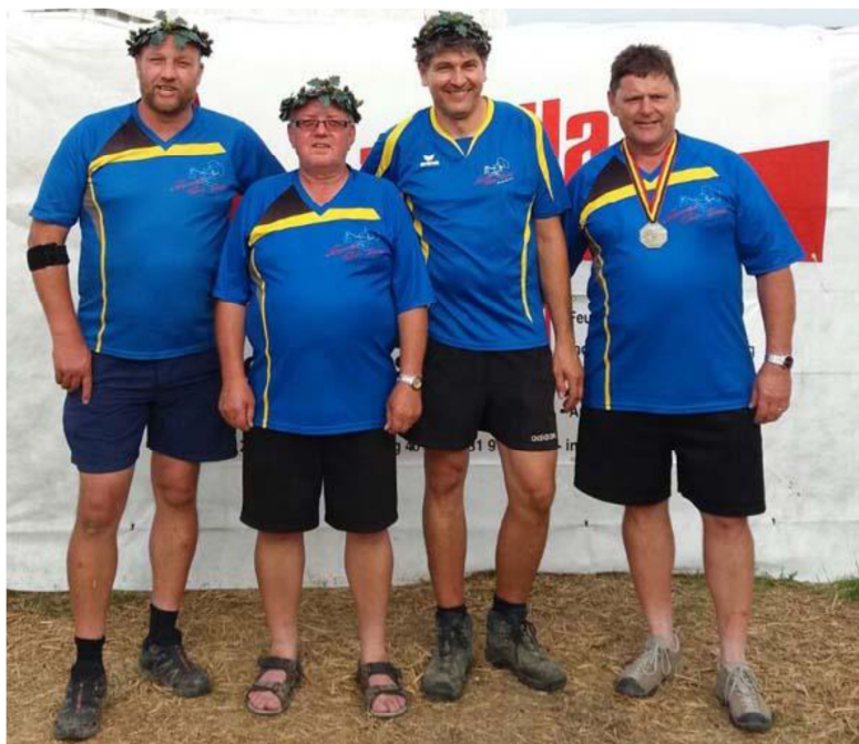
Bidu Rünzu Jürgu Dänu 101 Punkte 84 Punkte 88 Punkte 77 Punkte